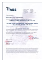
美国船级社工厂认可 (ABS)