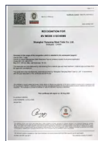
法国船级社工厂认可 (BV)