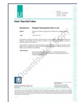
英国船级社工厂认可 (LR)