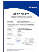
PED 97/23/EC AD2000 WO 欧盟 承压设备指令认证 (TUV NORD)