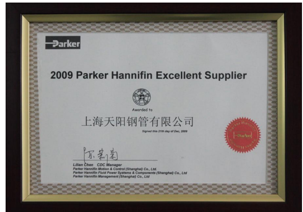
派克汉尼汾 (PARKER)优秀供应商