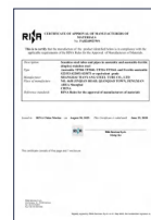
意大利船级社工厂认可 (RINA)