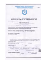
俄罗斯船级社工厂认可 (RS)