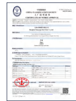
中国船级社工厂认可 (CCS)