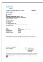
挪威-德国船级社工厂认可 (DNV-GL)