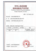
国家特种设备制造许可证 (压力管道A2级)