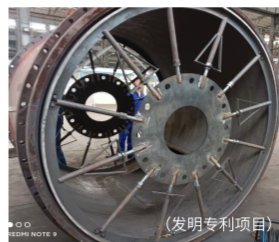
二重碳化钨陶瓷筒

建议我们预约一次线上视频会议或线下面对面交流，我们将为您带来最新最全更详实的资料。