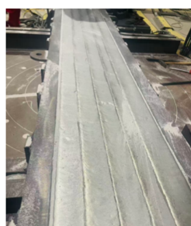
兰州长征带极空冷板堆焊