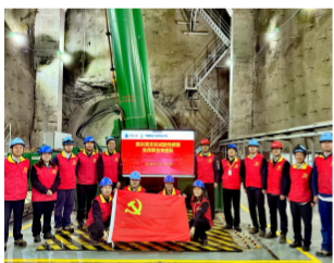
泄洪洞试验性修复