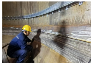
中国石化燕山石化公司 SEI焦炭塔 现场堆焊